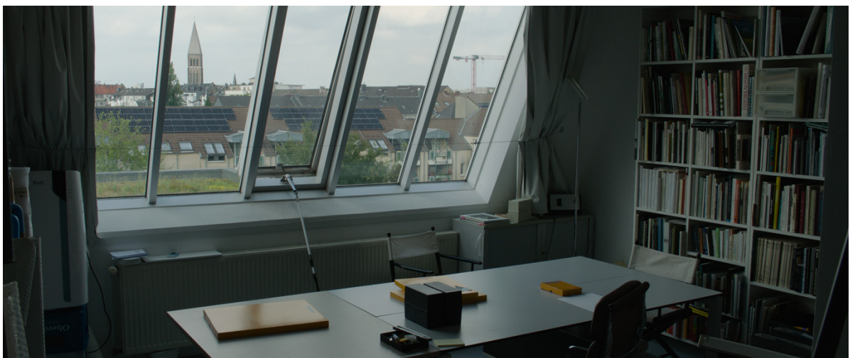
Filmstill: Im Atelier der Künstlerin