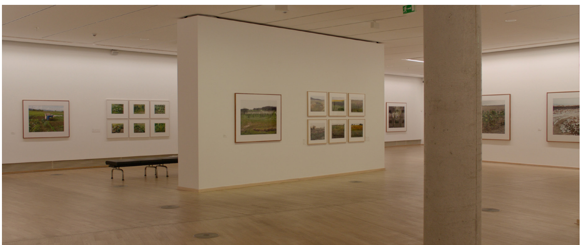
Filmstill: SK Stiftung Kultur in Köln