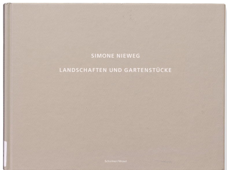
Simone Nieweg: Landschaften und Gartenstücke (2002) © Simone Nieweg