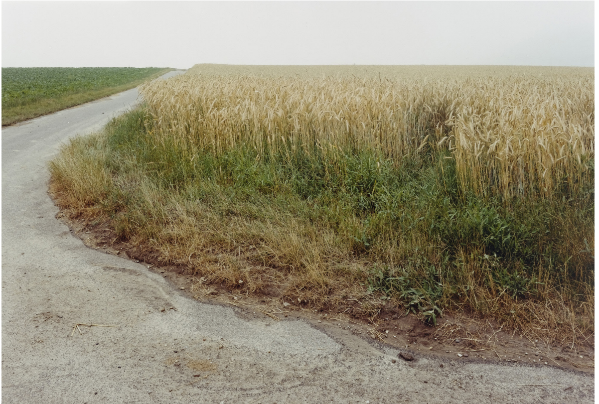
Simone Nieweg: Gerstenfeld, Brauweiler (1994), MoMA, © Simone Nieweg