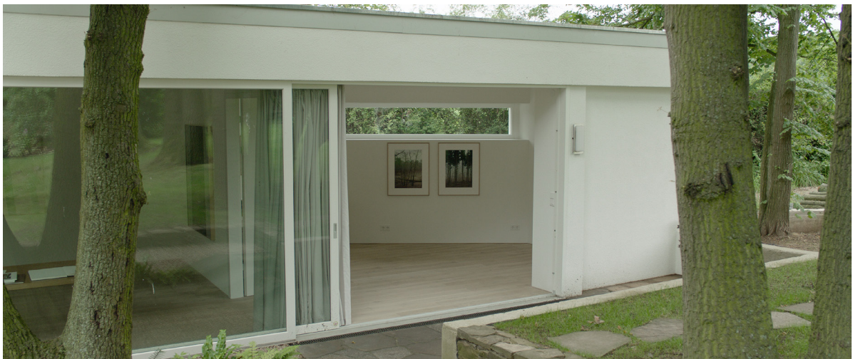
Filmstill: Galerie Haus Schlangeneck