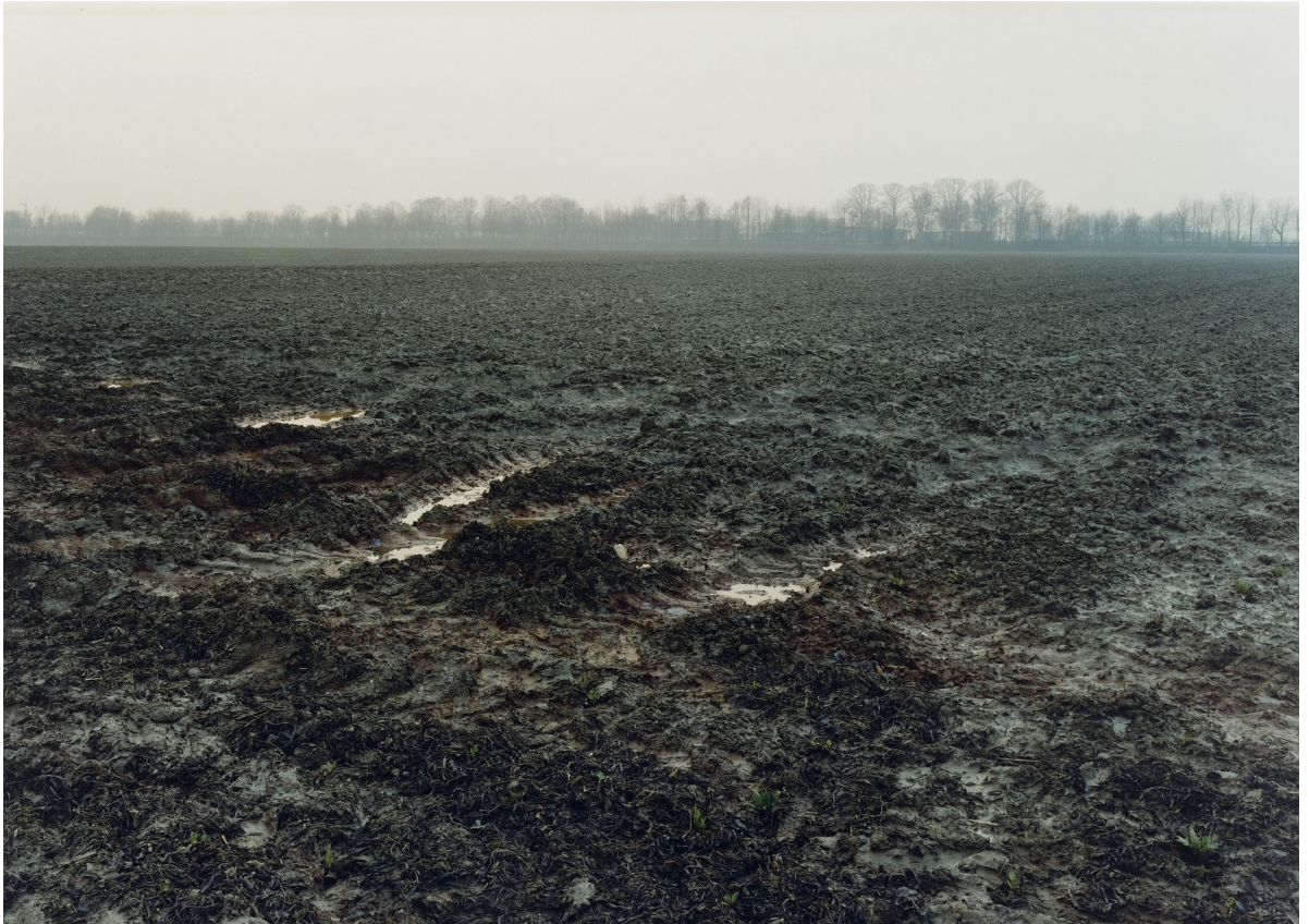
Simone Nieweg: Gepflügter Acker, Neuss-Kapellen (2001), MoMA, © Simone Nieweg