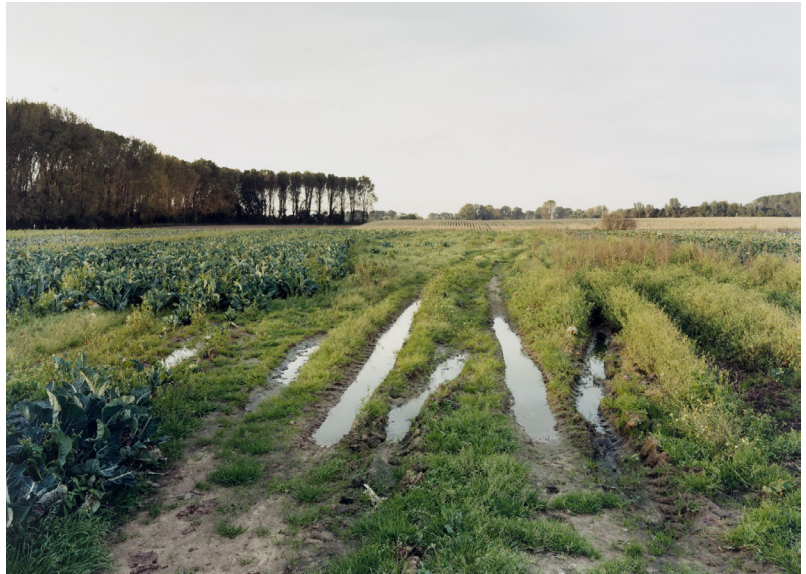
Simone Nieweg: Feldweg mit Pfützen (2001), MoMA, © Simone Nieweg