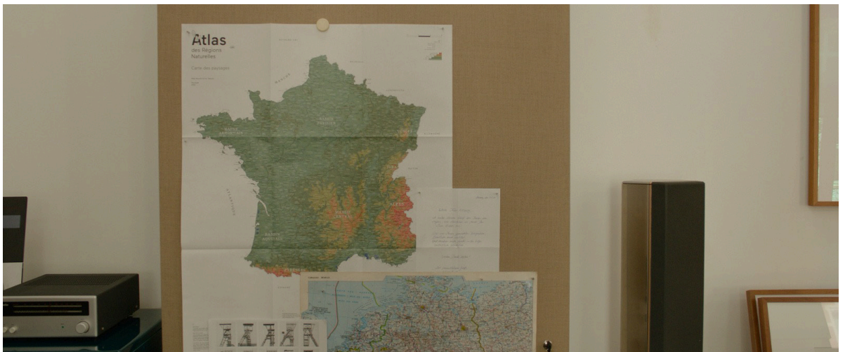
Filmstill: Im Atelier der Künstlerin