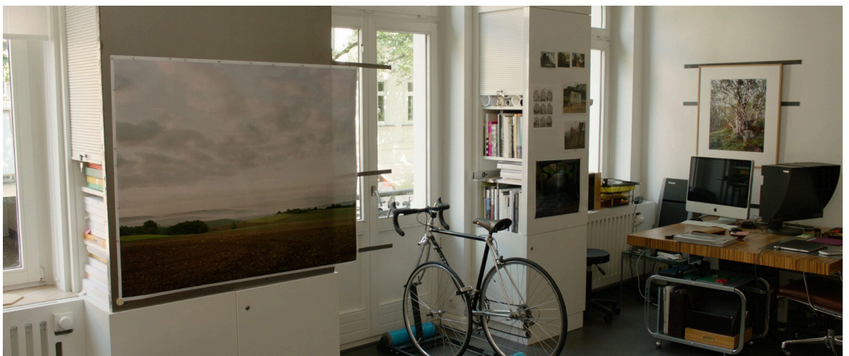
Filmstill: Im Atelier der Künstlerin