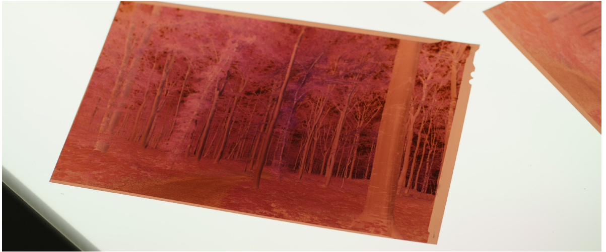
Filmstill: Im Atelier der Künstlerin