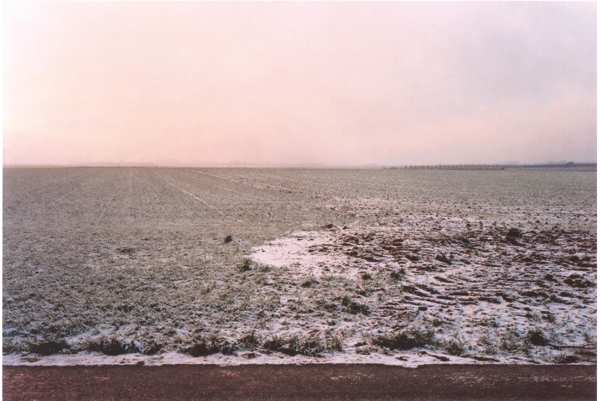
Simone Nieweg: Verschneites Feld, Liedberg (2003), (Buchscan)