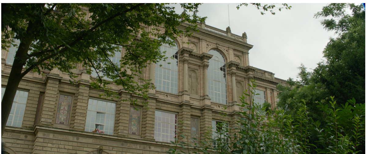
Filmstill: Die Kunstakademie Düsseldorf